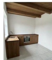
La cuisine telle qu'elle est maintenant et telle qu'elle sera après.

Malgré notre petite taille, nous sommes une église vivante qui se tourne résolument vers l'avenir.