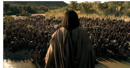
Les béatitudes Matthieu 5 versets 1 à 12

Heureux les humbles, car eux hériteront la terre !... Et qui s'est agenouillé devant ses disciples pour leur laver les pieds.