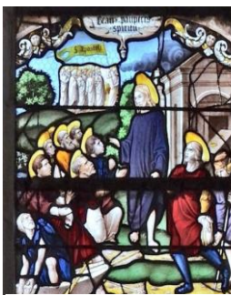
Vitrail des béatitudes église St Nicolas de Troyes.

Heureux les cœurs purs, car ils verront Dieu !... Et qui a laissé une femme verser un parfum de grand prix sur ses pieds.