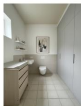
Les toilettes telles qu'elles sont actuellement et telles qu'elles seront ultérieurement.

Le conseil presbytéral envisage le déplacement des actuels W.C. dans l'appentis qui se situe en face des escaliers d'accès à la tribune du fond du temple. Ceci pour une meilleure accessibilité et dans un souci de mise aux normes et de modernisation. Il est également envisagé de créer, dans les dépendances qui se situent dans la petite cour, une cuisine fonctionnelle qui serait bien utile pour la préparation de nos repas partagés.