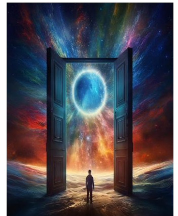
Une porte ouverte sur le monde

Une Église ouverte ne perd pas son identité. Elle la découvre autrement. Car l'ouverture n'est pas un affaiblissement. Elle est une fidélité. Fidélité à un Évangile qui ne trace pas des frontières, mais des chemins. Fidélité à un Christ qui n'a jamais attendu que les gens viennent à lui, mais qui est allé vers eux.