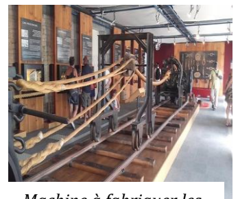
Machine à fabriquer les cordages exposés à la corderie royale de Rochefort.