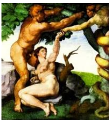
La Bible et ses fantômes de Didier Dumas

Le présent ouvrage propose une analyse tout à fait nouvelle de la mythologie biblique, plus précisément des onze premiers chapitres de la Genèse (de la Création à la Tour de Babel, de la descendance d'Adam à celle de Noé). L'auteur y démontre que la Bible est un livre qui fonde le patriarcat et la Genèse une thèse de psychanalyse transgénérationnelle, qui n'a rien à envier aux recherches théoriques les plus récentes en ce domaine.